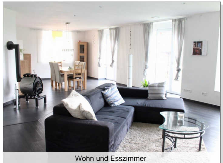
Wohn und Esszimmer