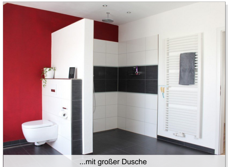
...mit großer Dusche