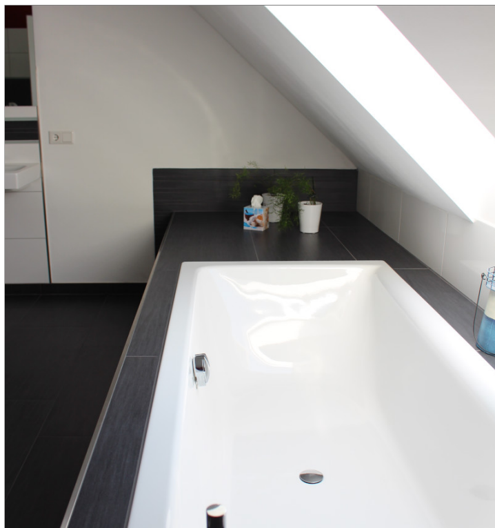
...und eingelassener Badewanne