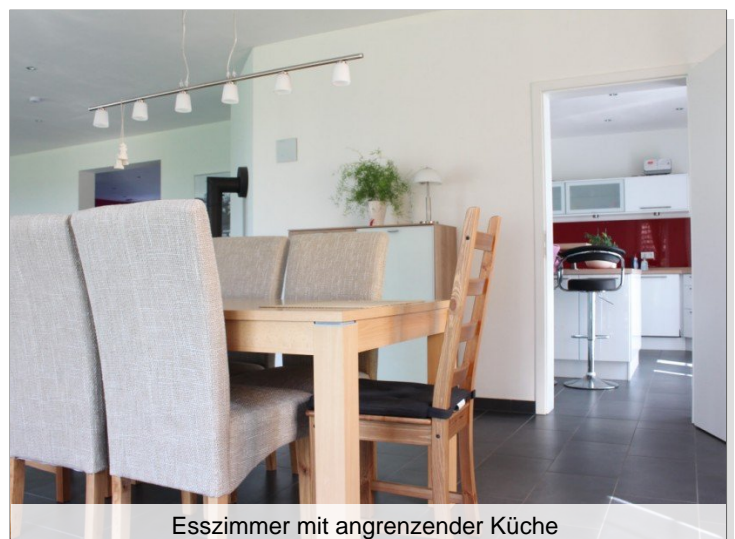
Esszimmer mit angrenzender Küche