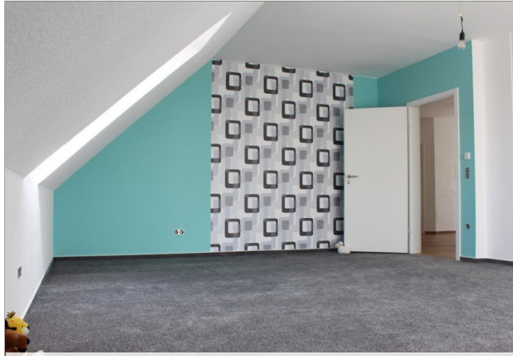
Ansicht eines Kinderzimmers